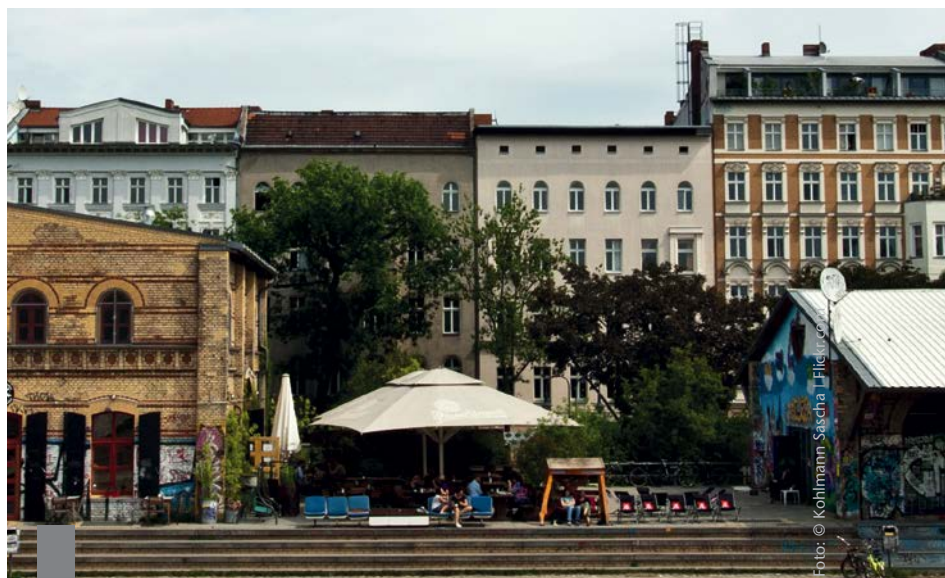
Der lange als entspannt geltende Wohnungsmarkt in Berlin gerät durch den anhaltenden Zuzug in die Hauptstadt zunehmend unter Druck.

Die Neuvertragsmieten für Wohnungen in Deutschland sind im vergangenen Jahr flächendeckend in allen Wohnwert- und Baualterklassen sowie in allen Städtegrößen gestiegen. Das ist das Ergebnis des IVD-Wohn-Preisspiegels 2013/2014. Die Angebotsmieten in München, Hamburg, Köln und Frankfurt sind laut Angebotspreisindex IMX im dritten Quartal 2013 dagegen erstmals seit mehr als einem Jahr leicht gesunken. Marktbeobachter bezeichnen die derzeitige Entwicklung als Seitwärtsbewegung und sehen sie als Indiz dafür, dass teilweise Preisobergrenzen erreicht wurden. Allerdings herrsche in den meisten Städten weiterhin ein Nachfrageüberhang. So lange sich diese Situation nicht ändert, sei mittelfristig ein weiterer Anstieg der Mieten zu erwarten. Die Folgen eines deutlichen Nachfrageüberhangs sind derzeit in Berlin zu beobachten. Dort sind die Neuvertragsmieten um 1,9 Prozent gestiegen. Berlin hatte jahrelang einen sehr entspannten Wohnungsmarkt. Durch den starken Zuzug in die Bundeshauptstadt hat sich die Situation dort inzwischen verschärft.